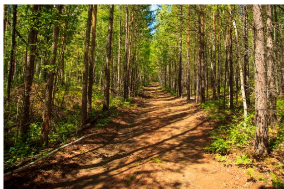
Рисунок 1. Лесовозная дорога

После стойбища продолжаем движение по лесовозной (через данную дорогу осуществляется вывоз древесных пород) дороге (см. Рисунок 1).