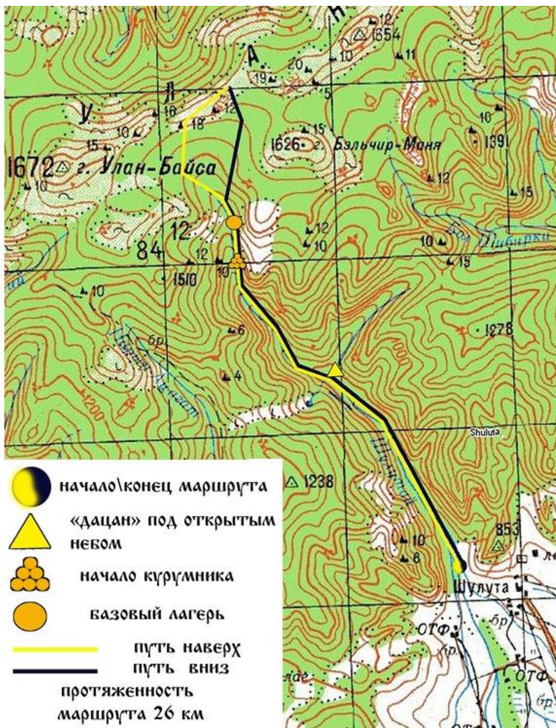
Карта-схема маршрута похода выходного дня «К Харашибирским столбам»