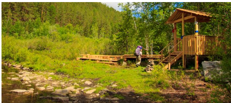
Рисунок 2. Беседка у ручья

По данной дороге движемся 5-6 километров. После чего выходим на святой ручей, вблизи которого располагается беседка для молебнов и отдыха (см. Рисунок 2)